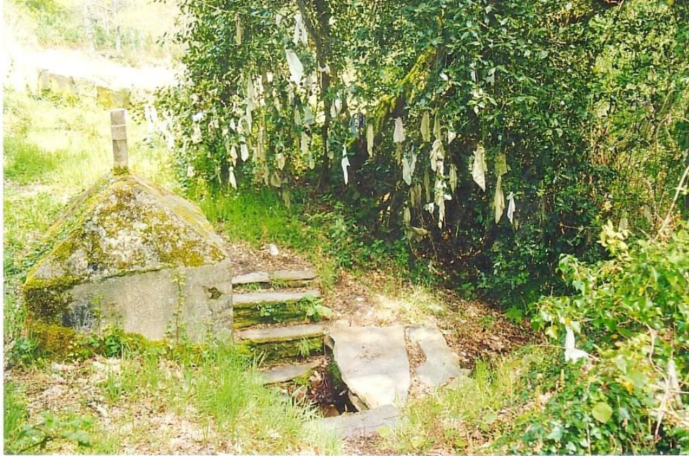
FONTE DO SAN VICTORIO (DAMIL) (BEGONTE). PANOS PENDURANDO DAS RAMAS DUNHAS ÁRBORES.