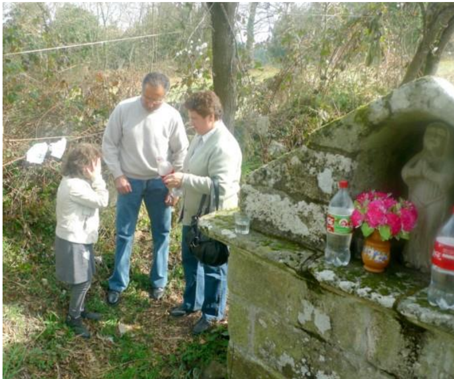
FONTE DE CARLÍN. RITUAL CURATIVO.