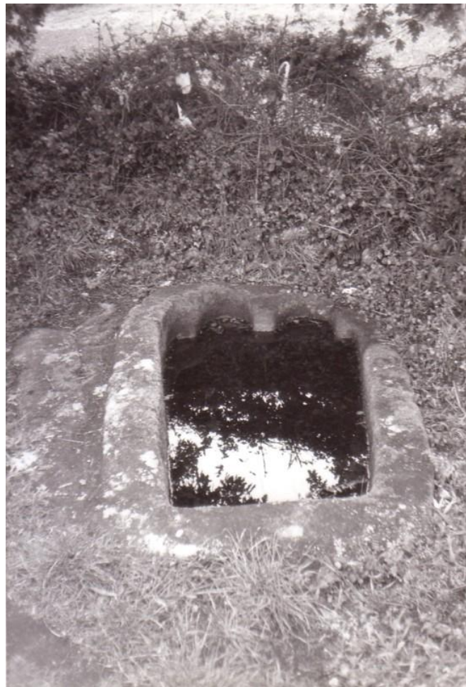
O SARTEGO DO SANTO MATÍAS ( O VERAL) (LUGO)