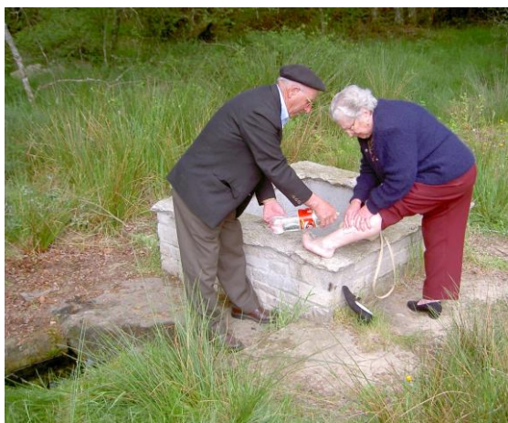
FORTE DO SAN ADRIANO (GOIRIZ) (VILALBA)