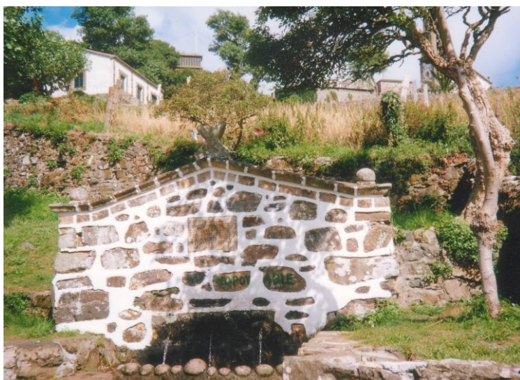
FORTE DE SAN ANDRÉS DE TEIXIDO. RITUAIS SANDADORES E ADIVIÑATORIOS.

de auga termal, que recibiu culto na Galicia e que foi asimilado a Apolo logo da conquista romana 48 . Edovio , goza dunha inscrición nunha arquiña de auga mineral descuberta en Caldas de Rei, preto do balneario. O epígrafe ten carácter votivo: Adalus Cloutani inscribe na pedra o seu agradecemento ao nume daquelas augas pola saúde que lle outorgaron 49 . A terceira divindade, de culto máis xeneralizado, é a deusa Navia , da que conservamos dous epígrafes – dos once existentes- no Museo provincial de Lugo. Posteriormente, coa romanización os deuses indíxenas foron relevados polas ninfas, que xa van a ser un elemento inherente en bastantes fontes galegas. Non embargantes, houbo deusas indíxenas, como a deusa da guerra Bandua , que logo da conquista romana cambio de función e pasou a ter un carácter de deusa protectora das comunidades indíxenas e, tamén, adquiriu o significado de divindade garante dos pactos, da paz 50 .