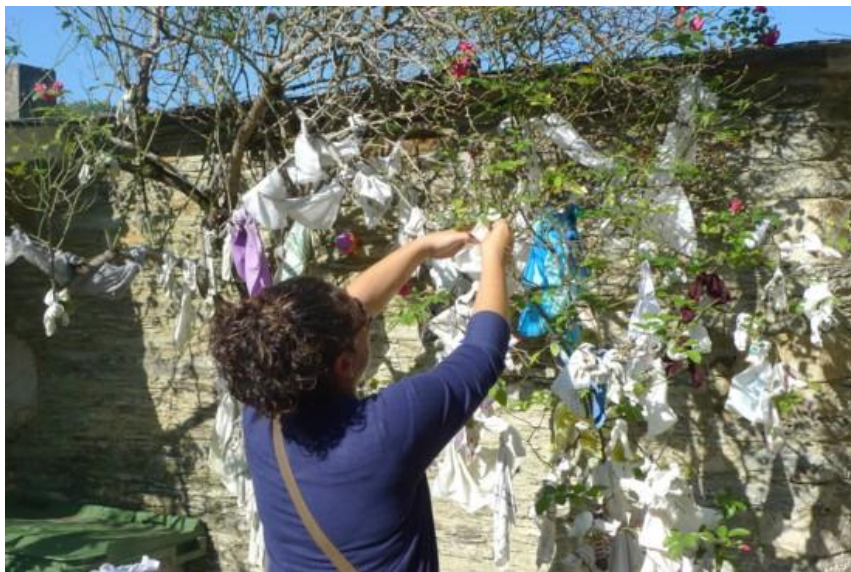
FONTE DA VIRXE DE CONFORTO ( A PONTENOVA).DEVOTA COLOCANDO UN PANO NA RAMA DUNHA ÁRBORE