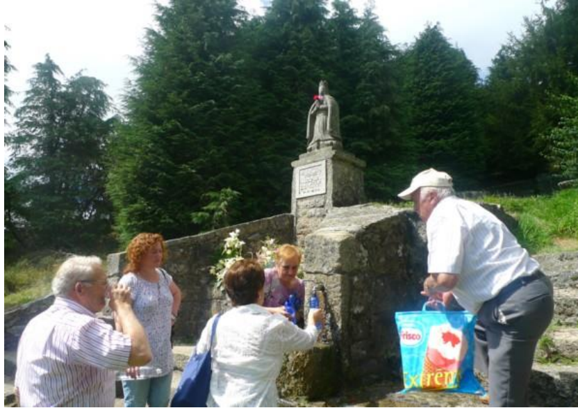
FONTE DA VIRXE DO FARO (REQUEIXO) (CHANTADA). DEVOTOS BEBENDO AUGA E LEVANDO A EN BOTELLAS PARA AS SÚAS FACENDAS.