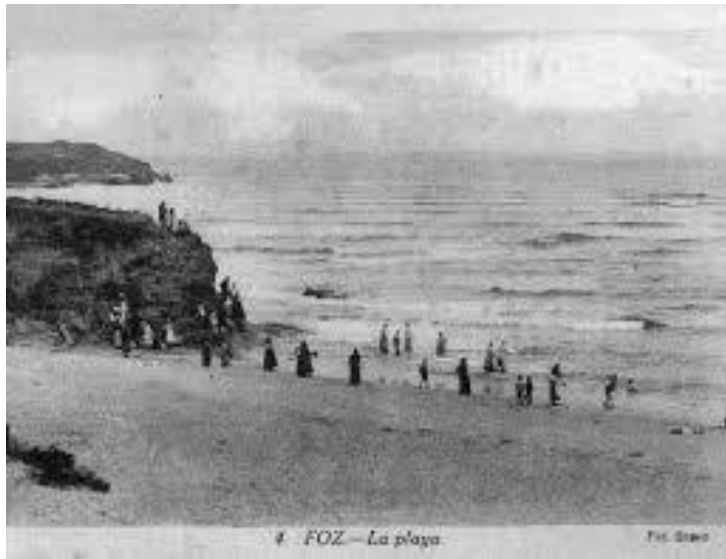
PRAIA DA RAPADOIRA( FOZ). BAÑOS DE SETEMBRO (SÉCULO XX. 1º METADE)