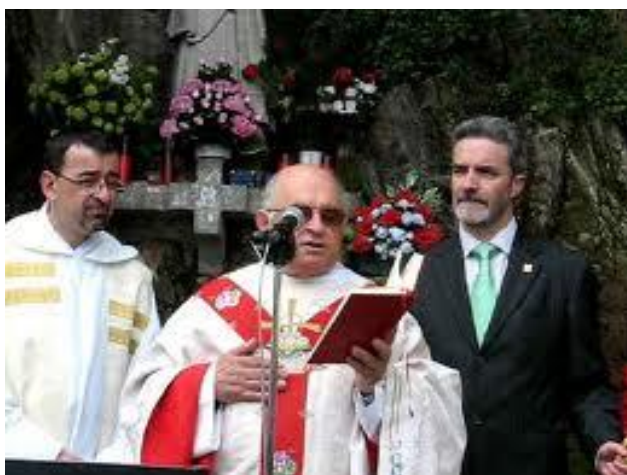
BENDICIÓN DE CAMPOS. MONFORTE DE LEMOS.

En San Vicente do Pino, hay tres festividades ligadas á Virxe de Montserrat: o Martes de Pascoa, que se conmemora o aniversario do voto á Virxe; o 27 de Abril, festa litúrxica da confraría de Montserrat; e o 15 de Agosto, festividade da patroa de Monforte.