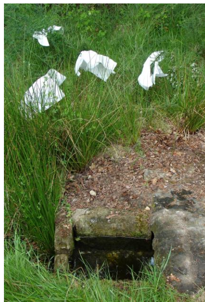
FONTE DO SAN ADRIANO (GOIRIZ). PANOS NO EXTERIOR E ANACOS DE PAN NO INTERIOR DA FONTE.

Este líquido elemento abranguería tanto as augas do espacio humano como ás que fican fora. Con respecto ás primeiras estaríamos a falar dun principio básico para o sustento cotián, que encontraríamos nos pozos e nas fontes das aldeas e lugares habitados. Nestes a muller tería un “rol” importante na procura da auga, que adoitaba traer ao mediodía e a noite para beber ou para facer a comida. Pola contra, todas as augas do exterior das entidades humanas e, polo tanto, augas non humanizadas, posúen unha serie de poderes, en canto que serven e se usan para levar a cabo determinados rituais ligados coa adiviñación, coa fecundidade e coa sandación 47 .