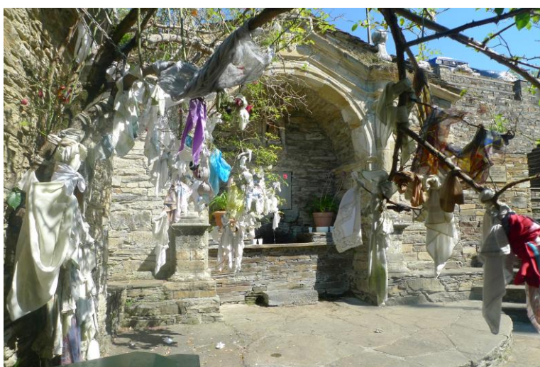
FORTE DO CONFORTO (A PONTENOVA). PANOS PENDURADOS AO CARÓN DA FONTE.

Polo que respecta á provincia de Lugo, cómpre mencionar a “ Fonte do San Adriano ” (Goiriz, Vilalba), onde se levaba a cabo un ritual moi semellante ao de San Andrés de Teixido. “ Había o costume de pedir por algúns familiares botando miolos de pan na