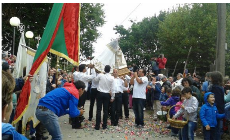
O CLAMOR DO DEZA. ABRAZO ENTRE IMAXES MARIANAS.

Dende hai moitos anos celebrábanse na comarca do Deza (Pontevedra) unha serie de rogativas, coñecidas co nome de Clamor. A estas acudían non só fregueses das diferentes parroquias, que integraban a confraría do mesmo nome, senón tamén outros pertencentes a freguesías limítrofes.