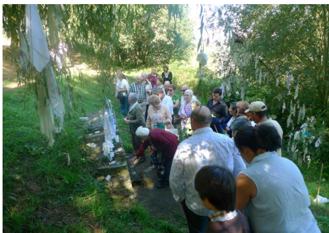
FORTE DE VILARMIDE (A PONTENOVA). OS DEVOTOS DEIXAN PENDURADOS PANOS DOS RAMALLOS

A práctica ritual debía levarse a cabo denantes do mencer do último sábado do mes de Agosto (festividade no recinto sacro), aínda que tamén eran días propicios os da