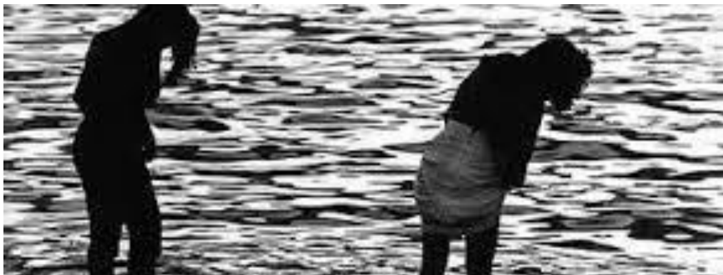
BAÑO NA LANZADA. RITUAL FECUNDADOR? REFERENCIA: ASCUNCASCULTURAIS.