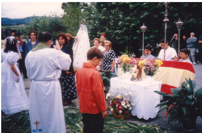
BENDICIÓN DOS CAMPOS (PORTOMARÍN)

Antano o día tres de maio – exaltación da Santa Cruz- había a práctica habitual de colocar, denantes de saír o sol, cruces de loureiro bendicido o Domingo de Ramos, naquelas terras de labor sementadas de trigo ou centeo. A cruz era o símbolo que protexía as colleitas non só dunha