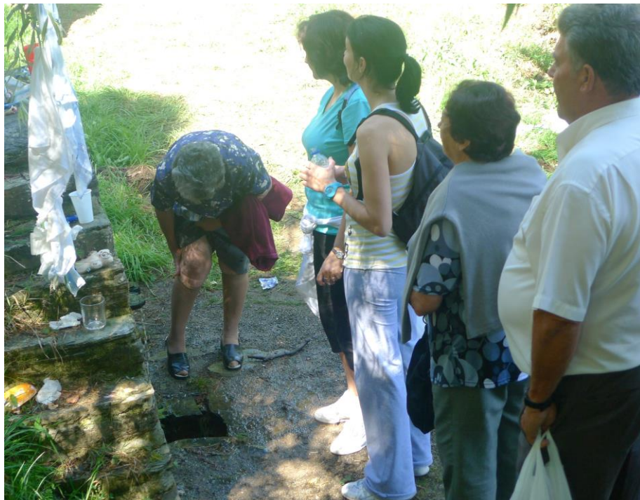
FONTE DO SAN PEDRO FIZ (VILARMIDE) (A PONTENOVA). RITUAL SANDADOR.