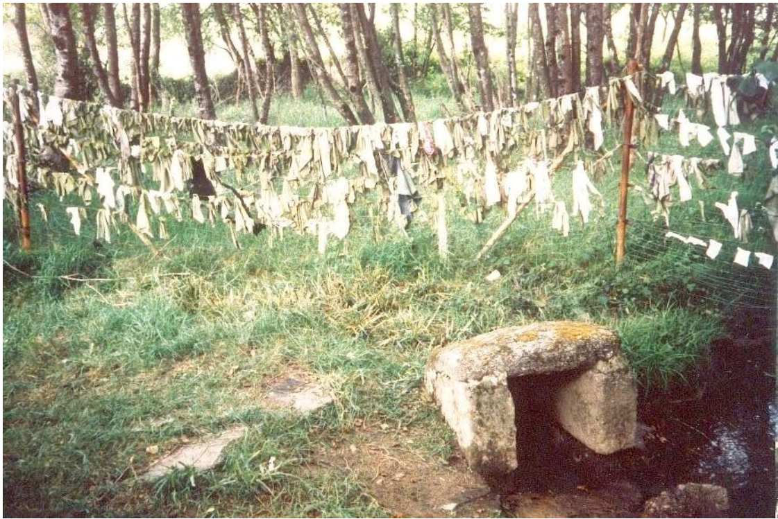
FONTE DAS VIRTUDES (PEDRAFITA) (O CORGO). OS DEVOTOS COLOCAN PANOS NUNS ARAMES.